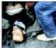
Turisti: un ferito negli sciatori

TUNISI. Forse decine di morti per la rivolta del pane in Tunisia, proseguita seri. Ancora ferite in Algeria. A PAGINA 7