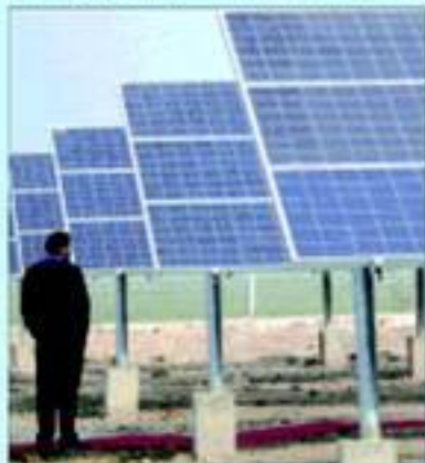
Pannelli solari in una zona agricola: come la regolamentazione della Regione

La giunta regionale toscana prova a frenare la proliferazione dei pannelli solari nelle campagne dove mettono in pericolo anche zone di pregio paesaggistico. Per questo si prova di indurre le installazioni di grandi impianti nelle aree urbane o degradate. La delibera di indulto approvata dalla giunta limita la diffusione dei grandi impianti fotovoltaici sulle aree agricole, favorendo quelli di piccola e media dimensione. E sile in un elenco di aree non idonee. Ma non tutti sono d'accordo: regolarizzare serve, ma va salvaguardata la crescita dell'economia verde. VALENTINI E FIORINI A PAGINA 3