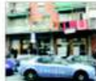
Genova: la scena della tragedia

GENOVA. Un pensionato di 70 anni geloso della moglie ha ucciso la donna e due fratelli, poi si è sparato. A PAGINA 5